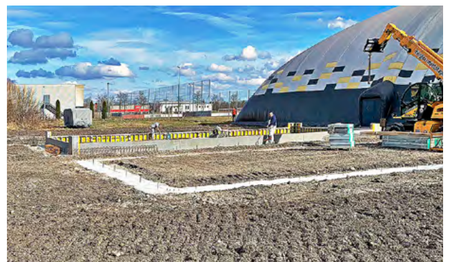
Betonieren der Fundamente mit einer Spezialschalung