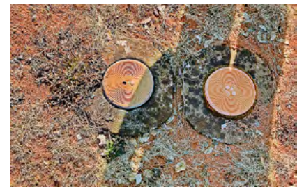
... und in Steinheim