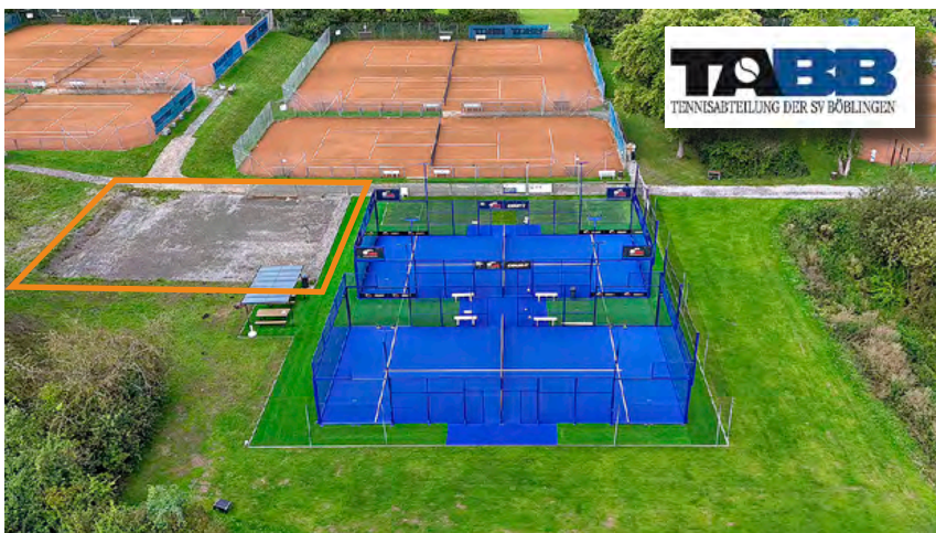
Die vorbereitete Erweiterungsfläche wurde früher als erwartet benötigt.

In Stuttgart-Degerloch wurde eine Kunstrasen-Multifunktionsfläche mitten in der Anlage umgewidmet. Die Platzverhältnisse sind sehr beengt, der neue Court bietet leider keine zusätzliche Auslauflächen. Die Fundamentstreifen integrierten wir bündig in die noch nutzbare Asphaltfläche, die Elektrifizierung übernahm unser Fachbereich TECH.