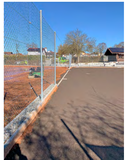
Neue Lavaschicht auf den Plätzen 1-3