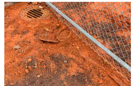
Sanierungsbedarf in Maichingen ...

Beim TV Steinheim war die Anlage sogar schon 1976 eingeweiht worden. Auch hier wurden zwei der insgesamt vier Plätze in gleicher Weise saniert; zusätzlich wurden alle sechs Regner je Platz getauscht und mit dem Betonschutzring installiert.