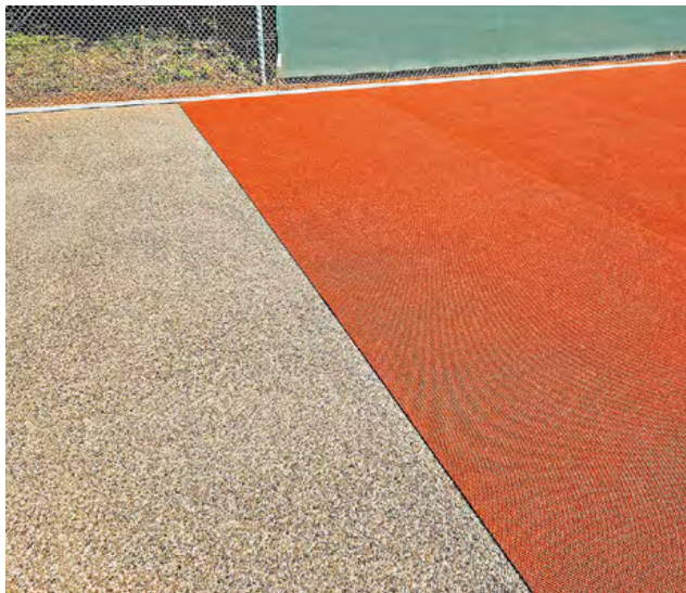
Hohe Stabilität und Ebenflächigkeit unter der langlebigen Membrane

Zu diesen Belagsarten zählen auch die beiden klassisch rot gefärbten Hybrid-Sand-Tennisbeläge Top Sand und TOP CLAY . Hierbei handelt es sich um langlebige Membransysteme mit vergleichbaren Spieleigenschaften wie klassische Ziegelmehlplätze, im Gegensatz zu diesen jedoch ohne Vertiefungen, Löcher oder Risse in der Oberfläche. Auf Top Sand spielen sich Spins, Top-Spins, Slices und Cuts wie bisher auf Sand, ebenso ist kontrolliertes Rutschen möglich. Das Ballabsprungsverhalten bleibt über die gesamte Spielfläche sehr gleichmäßig, und die Schnelligkeit der Beläge sind ebenso vergleichbar. Beide Systeme sind von der ITF (International Tennis Federation) als „Slow Class 1“ langsam eingestuft.