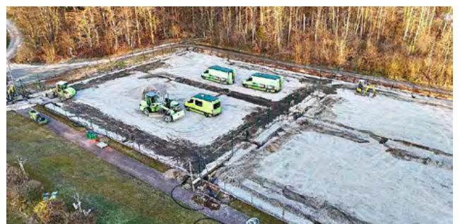
Aufbereitung des neuen Unterbaus