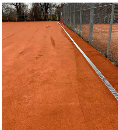
Neue Spielqualität bis in die Randbereiche