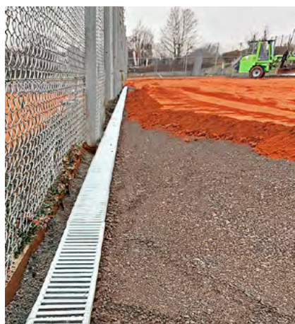
Neue Entwässerung für Starkregen

Moser Kunde hatte der Verein auch nichts anderes erwartet: „Wir arbeiten schon seit Mitte der 70er (!) Jahre sowohl in der Frühjahrsinstandsetzung als auch bei Sanierungen unserer Plätze sehr gut und erfolgreich mit der Firma Garten-Moser zusammen. Alles klappt pünktlich und zuverlässig, die Mitarbeiter sind kompetent – wir sind sehr zufrieden und unsere Mitglieder ebenso. Wir bleiben der Firma treu und freuen uns auf weitere Jahre.“