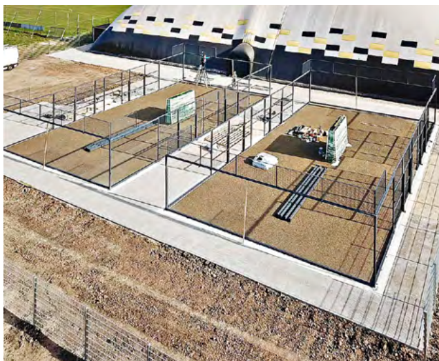
Montage und Elektrifizierung der Courts