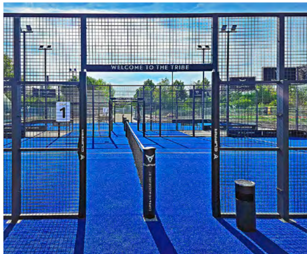
Seitliche Blickachse vom Court 1

In Böblingen nutzten wir die 2024 vorbereitete und bereits elektrifizierte Erweiterungsfläche für den dritten Platz. Zusätzlich erhielten die umlaufenden Wege einen Kunstrasenbelag.