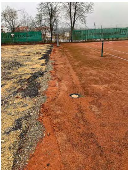
Übergang von der Grundsanierung zu Platz 4

Die weiteren Arbeiten waren der Einbau einer Entwässerungsrinne zwischen den Plätzen 1 und 4, darauf folgten der neue dreischichtige Aufbau des Spielfelds und die neue Ausstattung der Plätze. Zum Abschluss wurden alle Plätze spielfertig übergeben. Da der Platz 4 erst 2019 gebaut worden war, erhielt er im Zuge der Baumaßnahme eine professionelle Frühjahrsinstandsetzung.