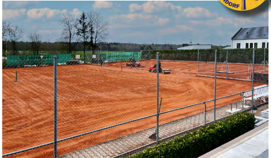
Frisch sanierte Anlage im Donauries

Unser Team Reutlingen übernahm diese Aufgabe im Februar 2025, nachdem der Verein in Eigenleistung bereits die Deckschichten abgetragen und entsorgt hatte. Auf einem frischen Feinplanum erneuerten wir die Zuleitungen der Beregnungsanlage und installierten neue Regner im Betonschutzring sowie eine automatische Steuerung und Kurzzeit-Schaltuhren. Ebenso bauten wir einen Systemtrenner ein, um die Vorgaben der Trinkwasserverordnung zu erfüllen.