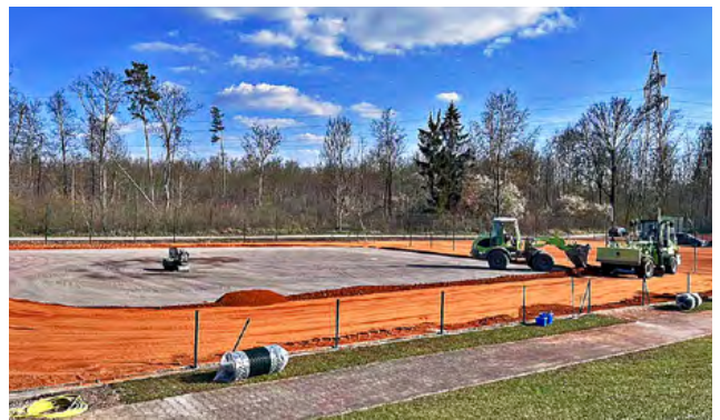
... und der neuen Ziegelmehl-Deckschichten