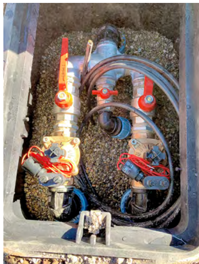
Optimierte Anschlüsse in den Ventilboxen