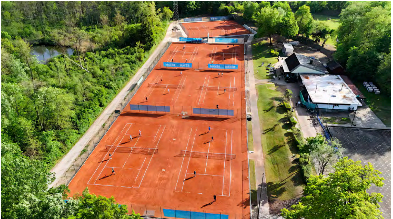
Die Plätze 1-6 im Vordergrund wurden komplett neu aufgebaut

Unser Team Reutlingen übernahm die Generalsanierung der Anlage. Die Plätze 1 – 6 mussten komplett neu aufgebaut werden, die ca. einen Meter höher liegenden Plätze 7 – 8 erhielten neue Deckschichten. Der Verein übernahm den Rückbau der Zaunanlage, räumte die Deckschichten an Platz 1 – 6 ab und erneuerte Teile der Pflasterwege.