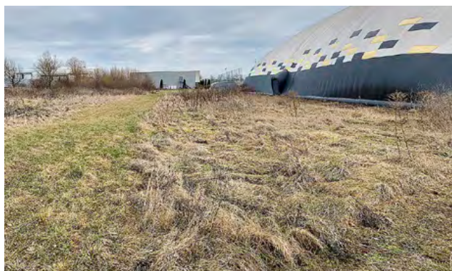
Ungenutzte Freifläche entlang der Traglufthalle

Bei allen drei Projekten wurden die Courts mit Flutlicht und Panoramaischeiben montiert. In Böblingen und Degerloch verfügen diese ab Werk über ein Vogelschutz-Muster mit definierter Punktrasterung.