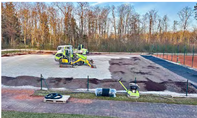
Einbringen frischer Lava ...

Im Zuge der Sanierung erweiterten wir den Bereich vor der Ballwand zur Multisportfläche. Sie erhielt einen ungebundenen Tragschichtaufbau innerhalb neuer Einfassungen und darauf einen gebundenen, 35 mm starken Kunststoffbelag PolyPlay S35. Darauf springen normale Tennisbälle beim Ballwandtraining ebenso ab wie die Kunststoffbälle im Trendsport Pickleball, der künftig beim FC Gundelfingen angeboten wird.