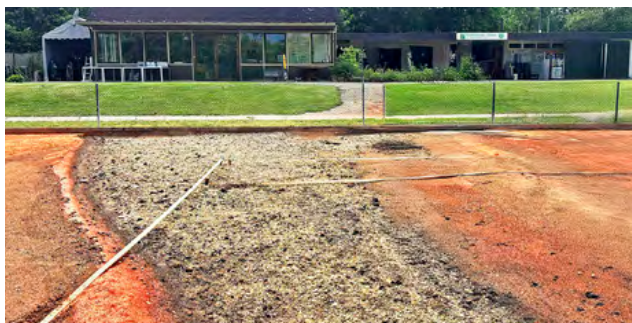
Frei in der Luft stehende Linierung ohne Schichtaufbau