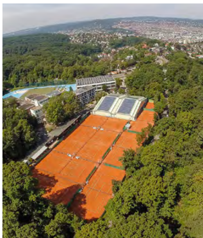
Topgepflegte STG-Anlage (Foto links und oben)

Aus unserer Sicht war und ist, neben einer professionellen Instandsetzung, der wöchentliche Platzwartservice ein Garant für Tennisplätze in bester Qualität.