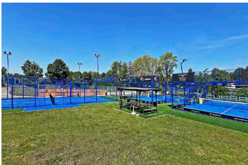
Auf drei Courts erweiterte Anlage mit umlaufenden Kunstrasenflächen, links der neue Court

Zur Halle hin ermöglicht eine „Kies- traufe“ die Versickerung von Regenwasser, auf der Pflasterfläche an Court 2 platzierte der Verein eine Technikhütte mit Freisitz. Die Zaunanlage um den Padelbereich schloss die zweimonatige Bauzeit ab.