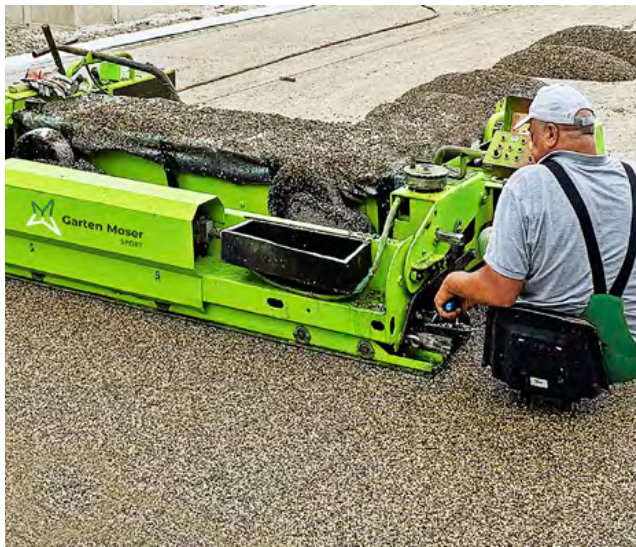
Einbringen der wasserdurchlässigen Tragschicht